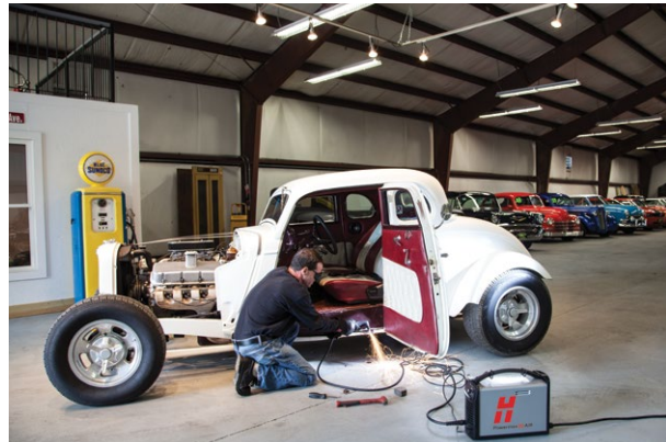
Voertuigreparatie en -aanpassing