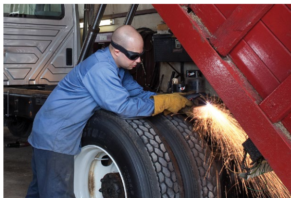
Voertuigreparatie en -aanpassing